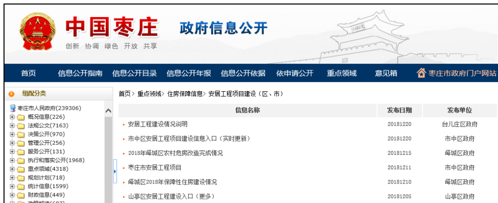
图：安居工程建设项目（区、市）