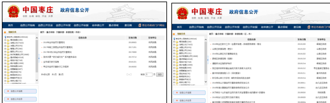
图：救援信息（市级）、救援信息（区、市）