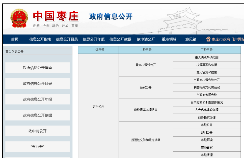
图：行政权力运行公开索引目录

积极推进行政决策公开、服务公开、管理公开、行政决策执行落实公开等五公开，服务社会发展，助力深化改革和法治政府建设。主要内容包括决策公开和执行落实情况公开。