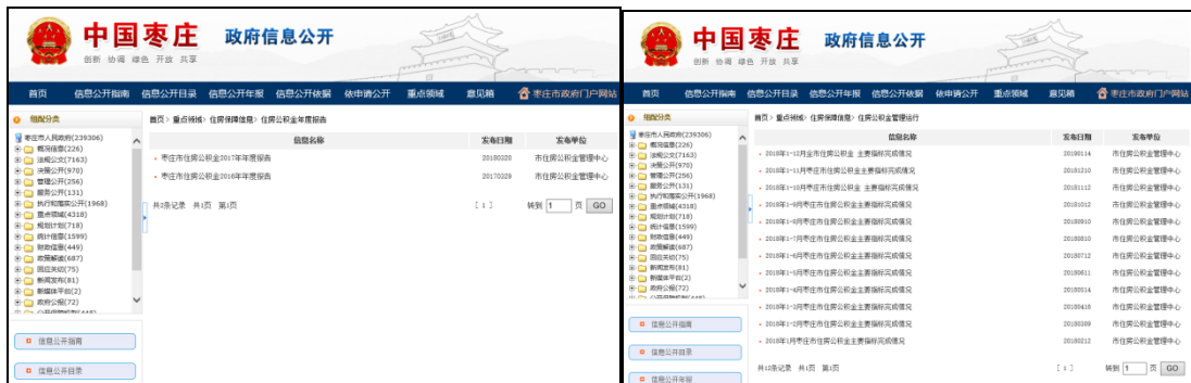
图：住房公积金年度报告、住房公积金管理运行