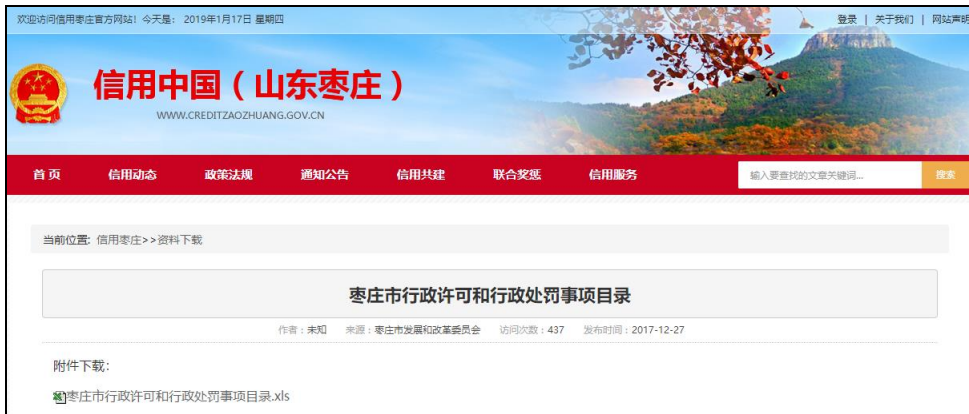
图：枣庄“双公示”目录