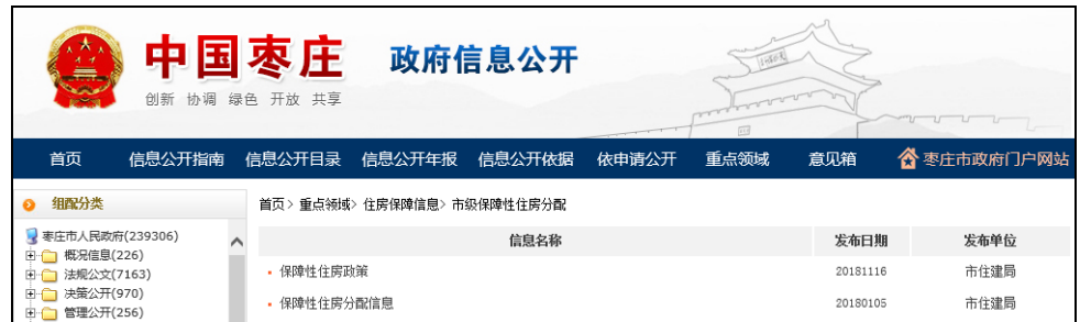
图：市级保障性住房分配