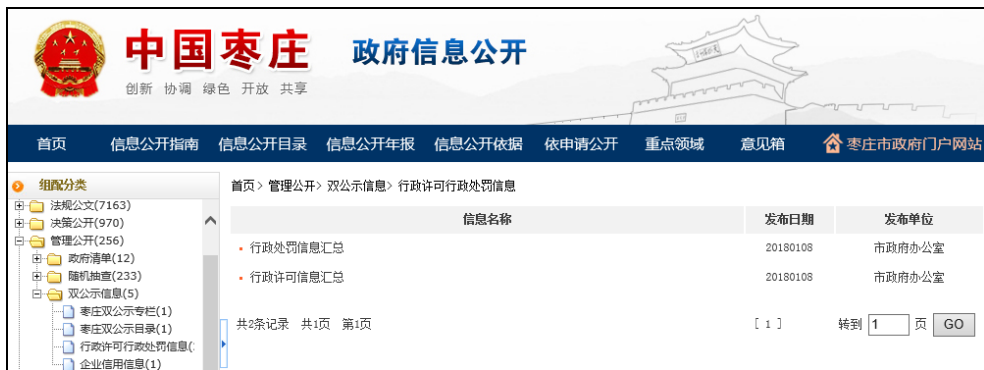
图：行政许可行政处罚信息