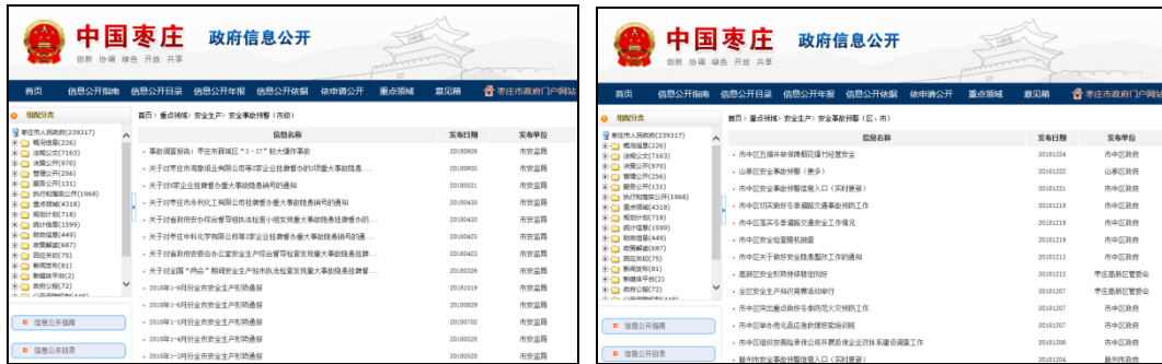
图：安全事故预警（市级）、安全事故预警（区、市）

安全生产信息公开包括安全事故警示提示信息、安全生产监管信息、安全生产不良记录“黑名单”、建筑市场安全监管信息等相关信息。