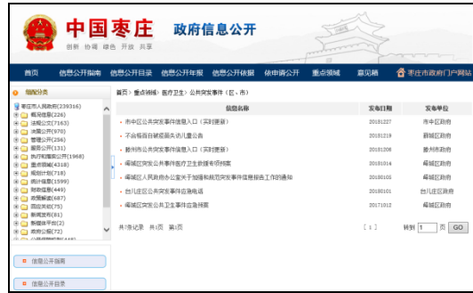
图：公共突发事件（市级）、公共突发事件（区、市）