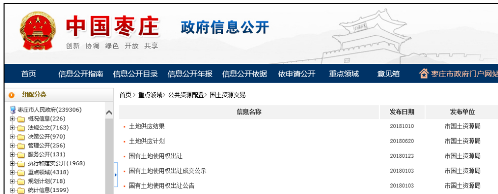
图：国土资源交易（供应结果、土地供应计划、成交公示、出让公告、出让公告公示）