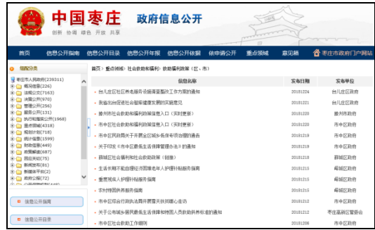
图：救助福利政策（市级）、救助福利政策（区、市）