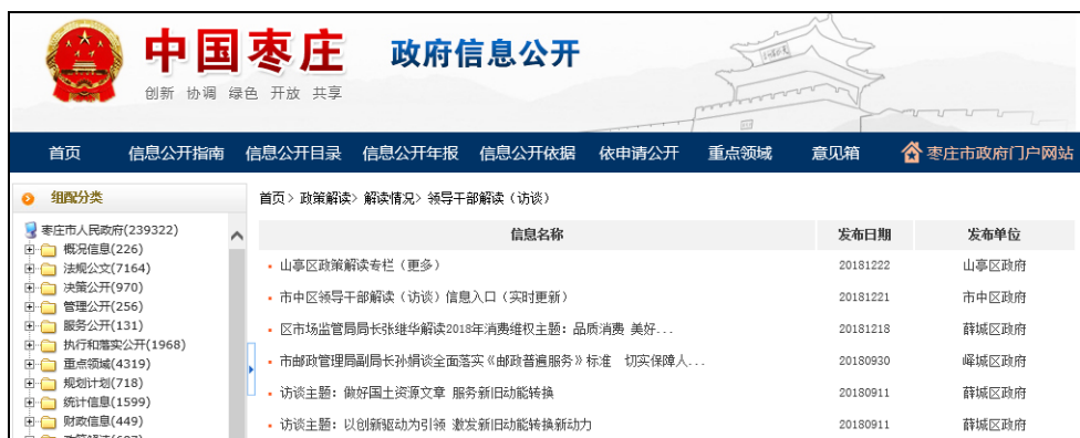
图：领导干部解读（访谈）