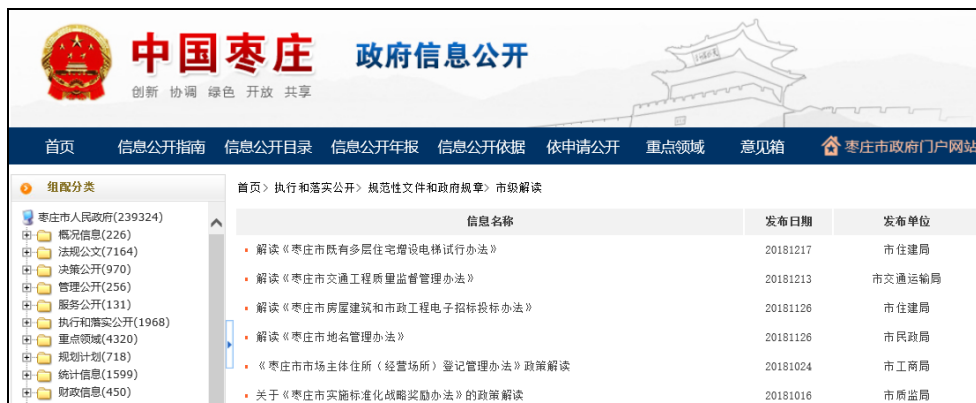
图：规范性文件解读

按照政策制定与政策解读“三同步”制度，坚持政策性文件与解读方案、解读材料同步组织、同步审签、同步部署，2018年主动公开规范性文件34件，并全部进行同步解读，对重大决策采用数字化、图表图解的方式进行解读。