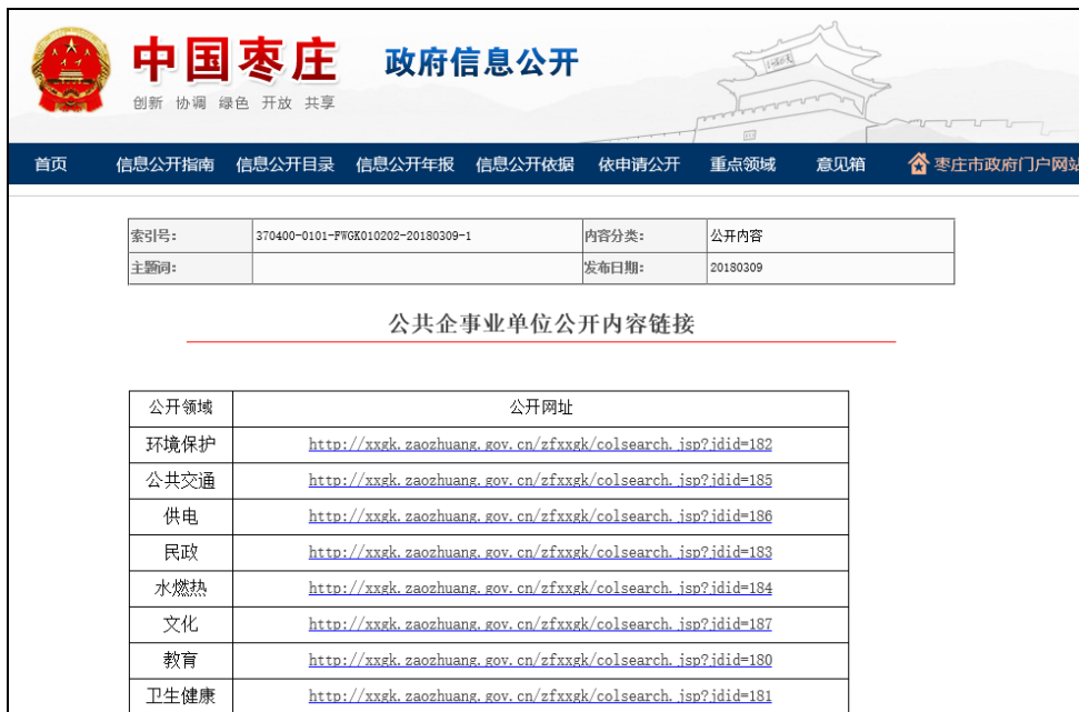
图：公共企事业单位公开内容