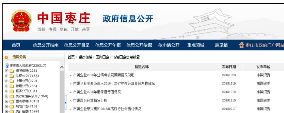
图：市管国企信息披露