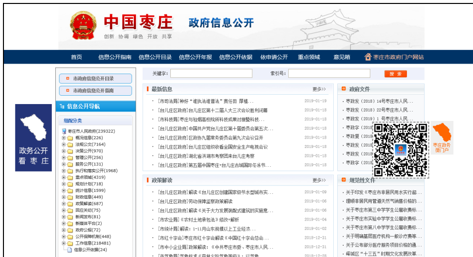
图：市政府门户网站信息公开专栏