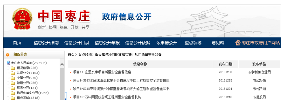
图：项目质量安全监督