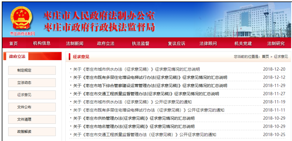
图：意见征集和结果