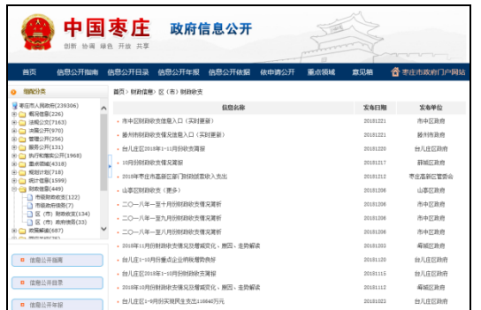
图：市级财政收支、区（市）财政收支