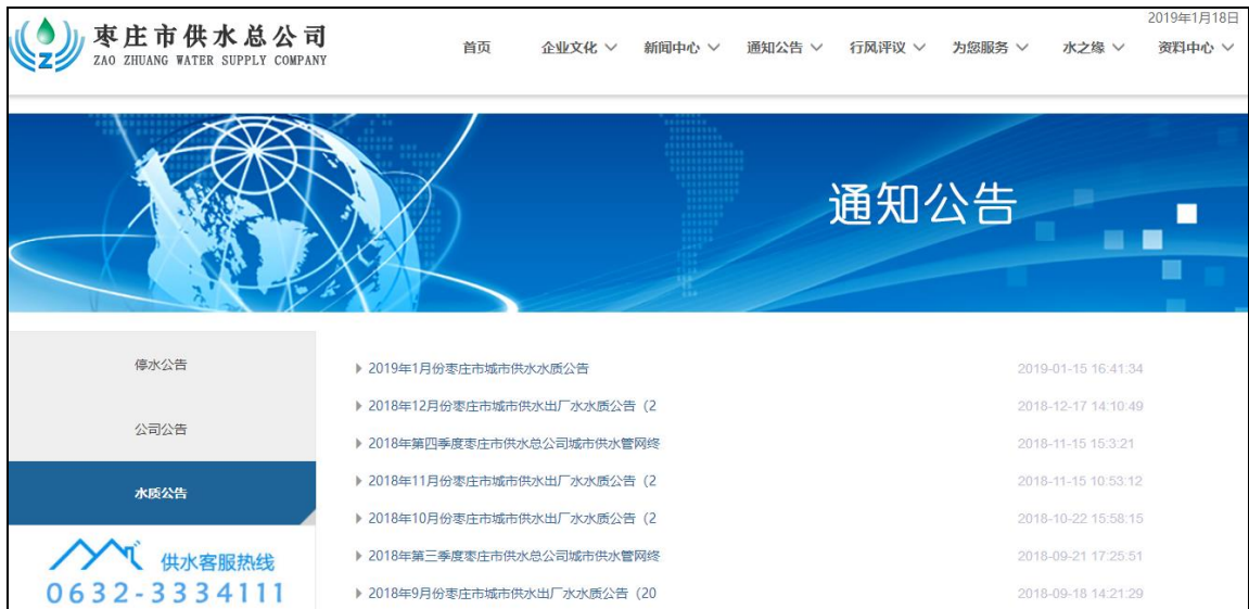
图：饮水安全信息（水厂）