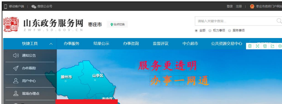
图：政务服务网入口（枣庄市）