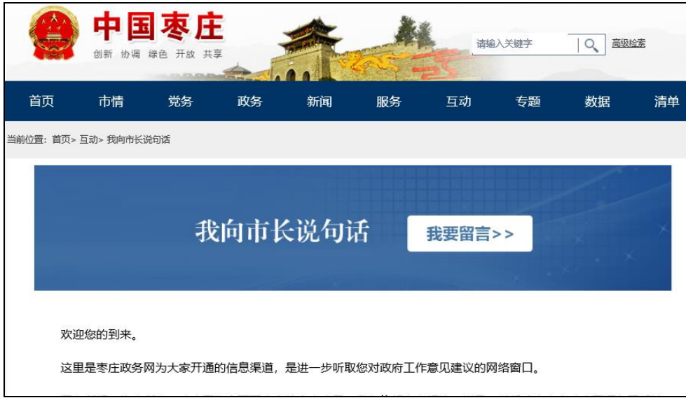
图：我向市长说句话