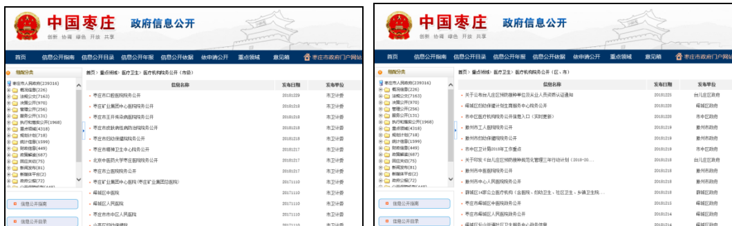
图：医疗院务公开（市级）、医疗院务公开（区、市）

基本医疗卫生公开包括医疗院务公开、改善医疗服务行动信息；医疗服务与常用药品价格信息等。