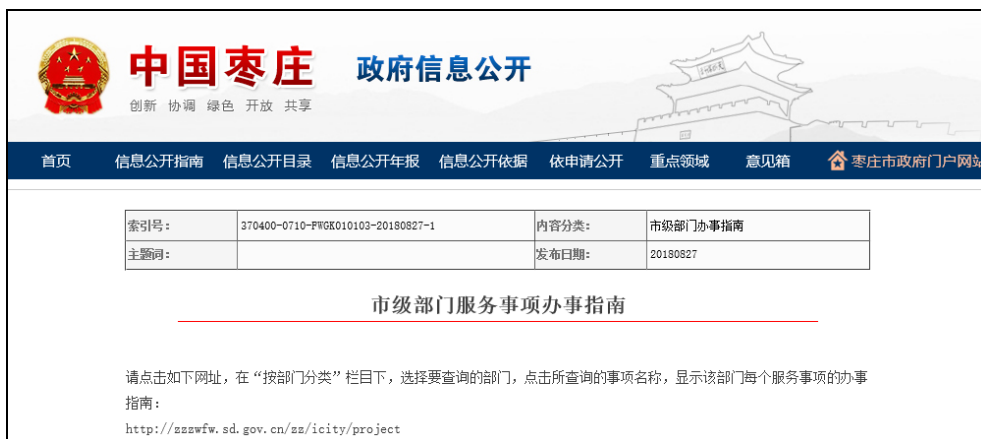
图：市级部门办事指南