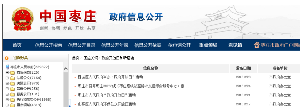
图：政府开放日和听证会

公室牵头举办了全市首个“政府开放日”活动，作为山东省政务公开工作典型案例在国务院政务公开交流的“工作简讯”专题中进行了报道。各级政府也建立健全了“政府开放日”活动制度，并结合实际开展“政府开放日”活动。“政府开放日”活动和听证会制度，增进了政府和市民的沟通联系，全面推进政务公开，切实推进阳光、透明、开放、服务型政府建设。