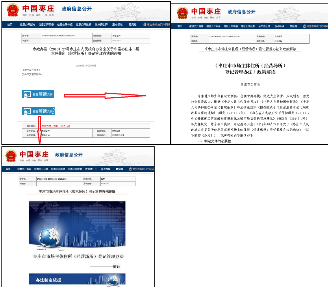
图：源文件和解读文件之间的关联性