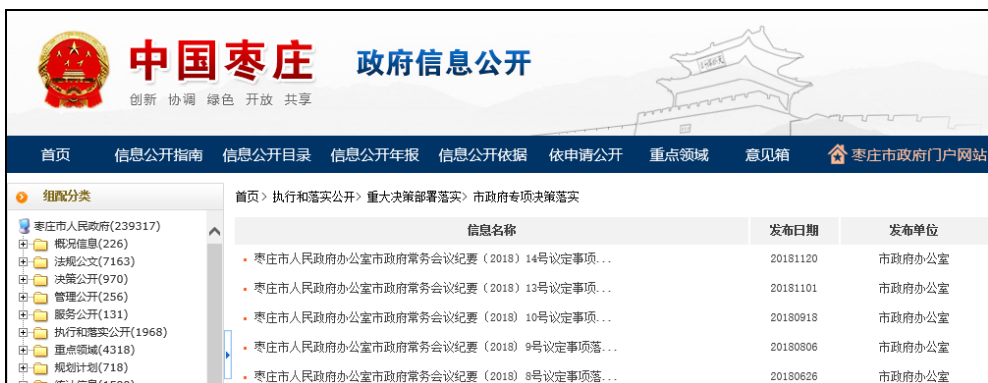
图：市政府专项决策落实