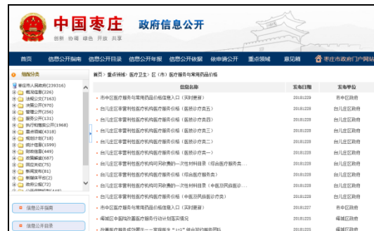
图：市级医疗服务与常用药品价格、区（市）医疗服务与常用药品价格