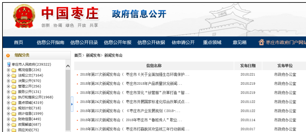
图：新闻发布会解读

举办新闻发布会43次,主要负责同志参加新闻发布会30次,重点对市委、市政府新旧动能转换重大工程、重点项目建设、环境保护、精准扶贫等重点工作进行解读。