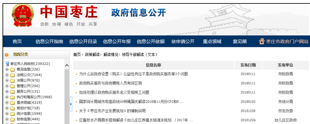
图：领导干部解读（文本）

发布政策解读稿件 203 件，政府网站在线访谈 16 次，主要负责同志参加政府网站在线访谈 5 次。