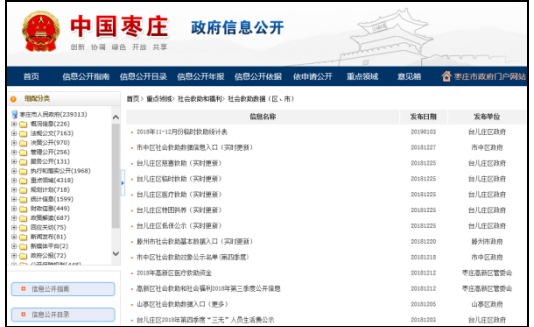
图：社会救助数据（市级）、社会救助数据（区、市）