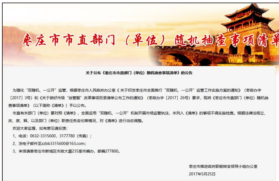
图：枣庄市随机抽查事项清单