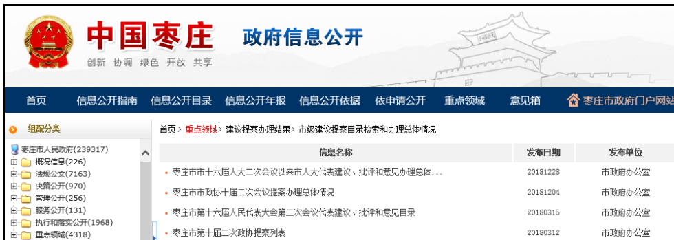
图：市级建议提案目录检索和办理总体情况

建议提案办理结果公开是对人大代表建议和政协委员提案办理复文全文或摘要以及总体情况进行公开，并设立市级建议提案目录检索，便于公众查阅。