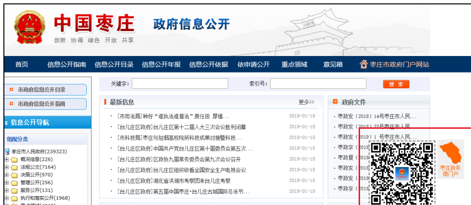
图：“枣庄政务”微门户

在“政务公开看山东”新媒体平台发布稿件 13 篇，建立了“政务公开看枣庄”平台，设置了政务公开工作经验、理论研究、政策解读和基层试点等栏目，发布各区（市）和部门工作稿件 53 篇。