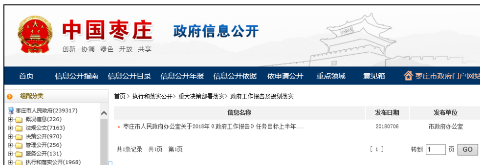
图：政府工作报告及规划落实