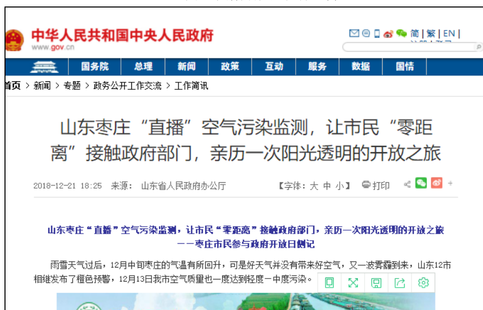
图：枣庄环保开放日活动在国务院网站报道