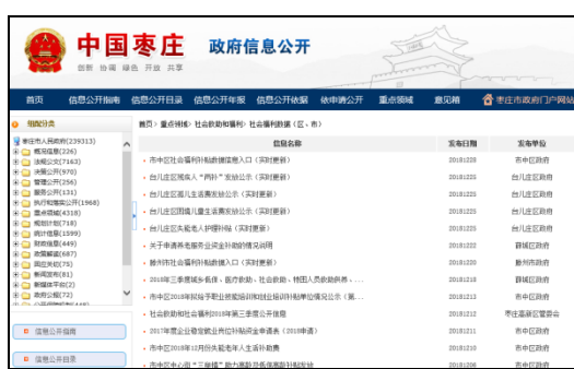
图：社会福利数据（市级）、社会福利数据（区、市）