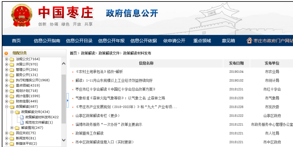
图：政策解读材料发布

按照政策制定与政策解读“三同步”制度，坚持政策性文件与解读方案、解读材料同步组织、同步审签、同步部署，2018年主动公开规范性文件34件，并全部进行同步解读，对重大决策采用数字化、图表图解的方式进行解读。