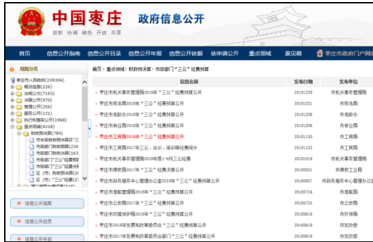
图：市级部门预算、市级部门“三公”经费预算