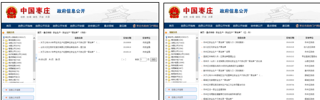
图：安全生产“黑名单”（市级）、安全生产“黑名单”（区、市）