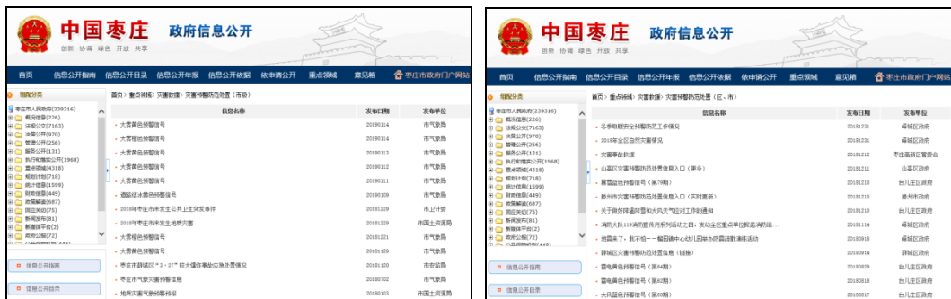
图：灾害预警防范处置（市级）、灾害预警防范处置（区、市）

灾害事故信息公开包括灾害预警防范等工作情况及动态信息，灾害、事故救援信息的公开。