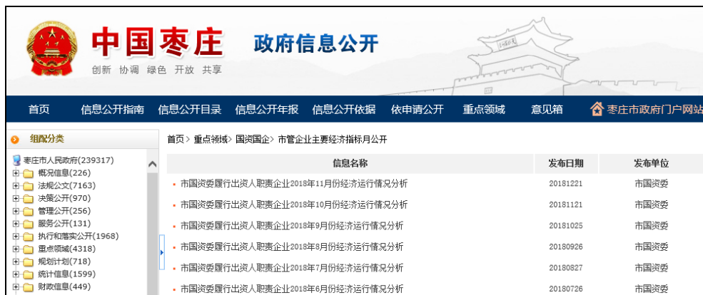
图：市管企业主要经济指标月公开