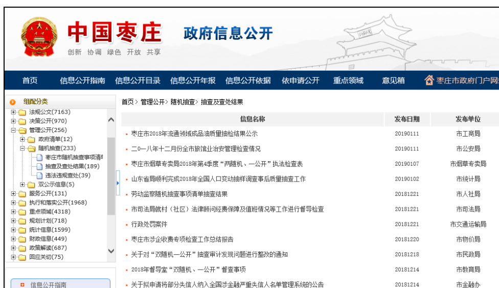
图：抽查及查处结果