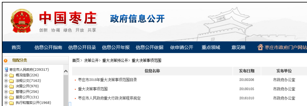
图：重大决策事项范围