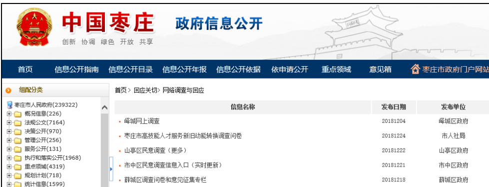
图：网络调查与回应