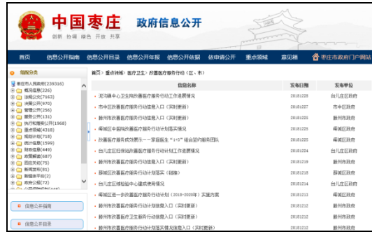
图：改善医疗服务行动（市级）、改善医疗服务行动（区、市）