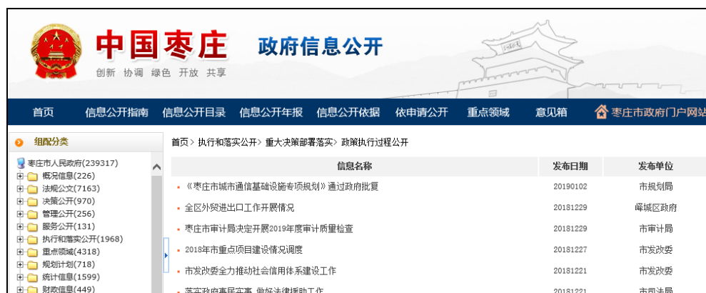
图：政策执行过程公开

重大决策部署落实情况公开是对国家、省政府、市政府重大决策及政策部署以及政府工作报告、发展规划、改革任务或民生实事项目、政府决定事项进行公开。