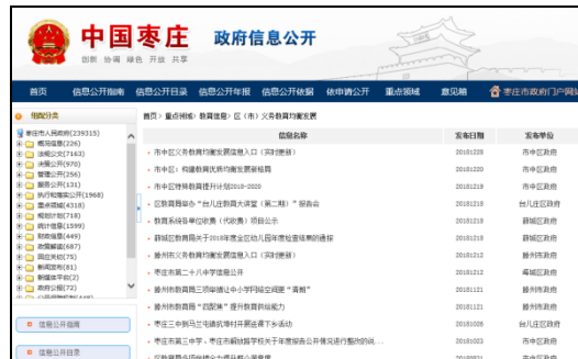
图：义务教育均衡发展、区（市）义务教育均衡发展