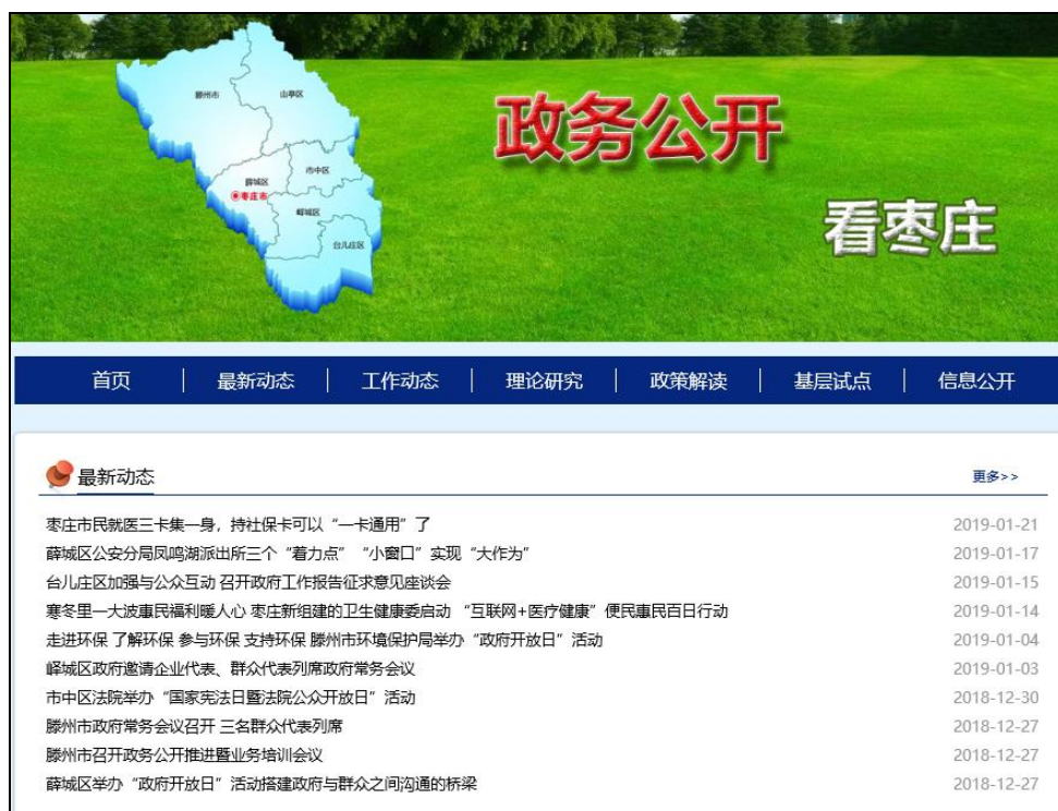
图：政务公开看枣庄

在“政务公开看山东”新媒体平台发布稿件 13 篇，建立了“政务公开看枣庄”平台，设置了政务公开工作经验、理论研究、政策解读和基层试点等栏目，发布各区（市）和部门工作稿件 53 篇。