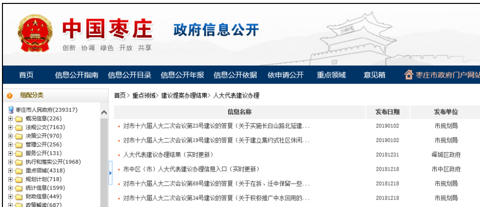
图：人大代表建议办理