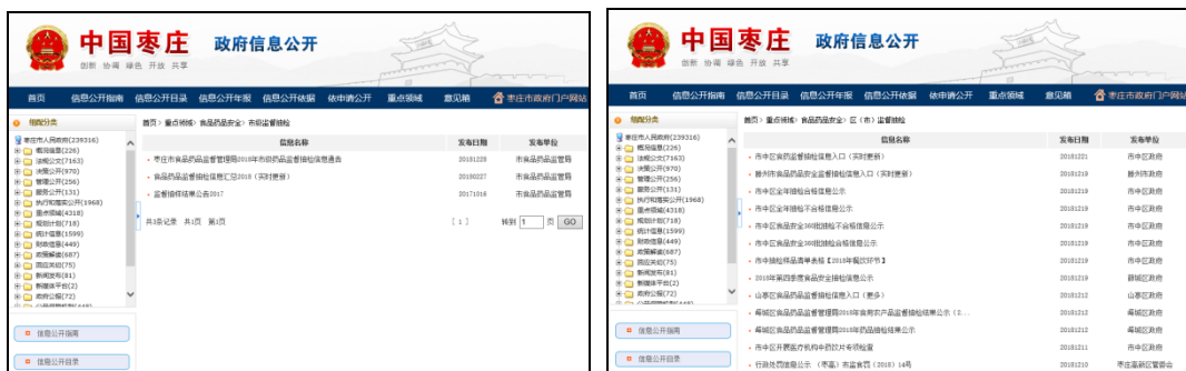
图：市级监督检查、区（市）监督检查