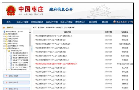
图：市级部门决算、市级部门“三公”经费决算