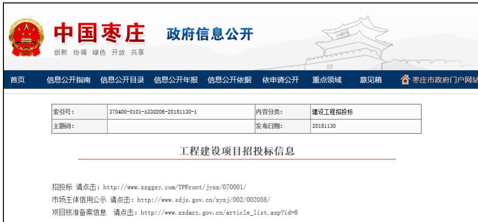
图：工程建设项目招投标信息

工程建设项目招标投标公开是对依法必须招标项目的审批核准备案信息、市场主体信息等信息以及招标公告、中标候选人、中标结果等信息进行公开。