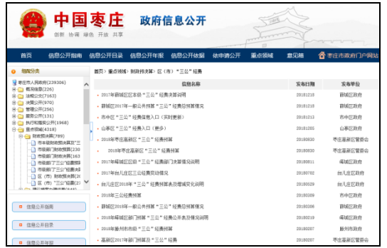
图：区（市）财政预决算、区（市）三公经费