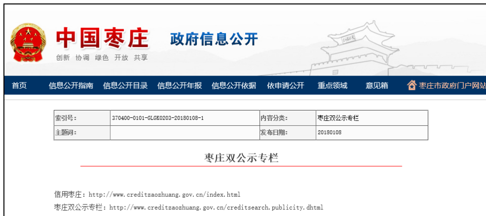
图：枣庄“双公示”专栏