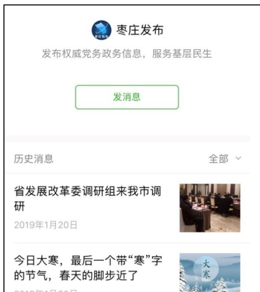
图：“枣庄发布”公众号