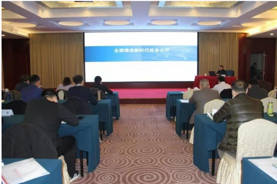
为贯彻落实全省政务公开推进会精神，进一步提升委机关干部和全省民族宗教工作系统政务公开工作能力和