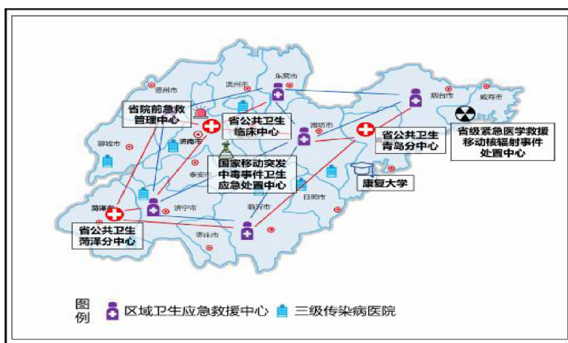
图3 应急医疗卫生保障布局示意图

资保障、交通运输、生产运行、治安维护等各项工作。强化鼠疫、霍乱等甲类传染病以及乙肝、结核病等发病率较高传染病暴发流行情况下的各项应急准备。实施差异化精准防控和精细化管理，加强村（社区）等基层联防联控能力建设，织密织牢第一道防线。