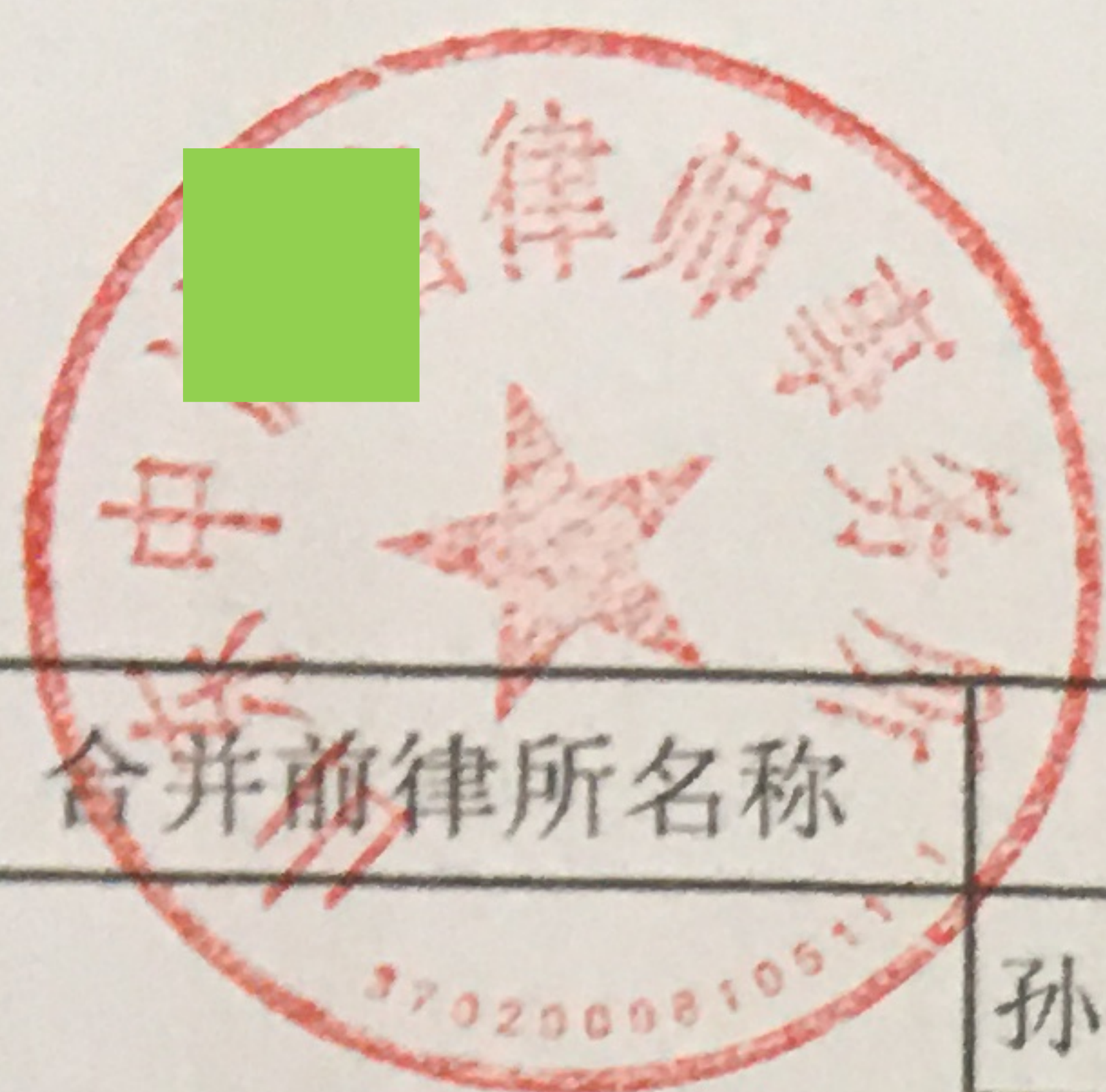
山东中诚信律师事务所注册资金明细表